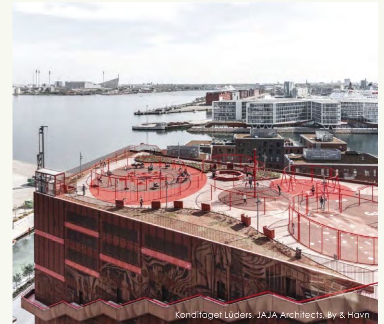
Konditaget Lüders, JAJA Architects, By & Havn

Travbyen vil blive udviklet med afsæt i forskningsbaseret viden om læring gennem leg. Udover det typiske byggeprogram, der beskriver, hvad der skal bygges, bliver der også udarbejdet et legeprogram, der beskriver, hvordan man kan integrere leg i boliger, byrum, butikker osv. Ikke kun for børn, men for alle aldersgrupper. Børn og unge bliver inviteret med til at udvikle nogle af kvarterets tilbud sammen med arkitekter, ingeniører, entreprenører, håndværkere og alle de andre fagligheder. Sammen med legeprogrammet skal den samskabende proces være med til at sikre, at Travbyen bliver et sted, hvor leg, kreativitet og nysgerrighed er kvaliteter i hverdagen for alle.